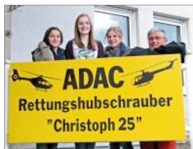
Der Girls' Day öffnet Schülerinnen Türen zum ADAC-Rettungshubschrauber.